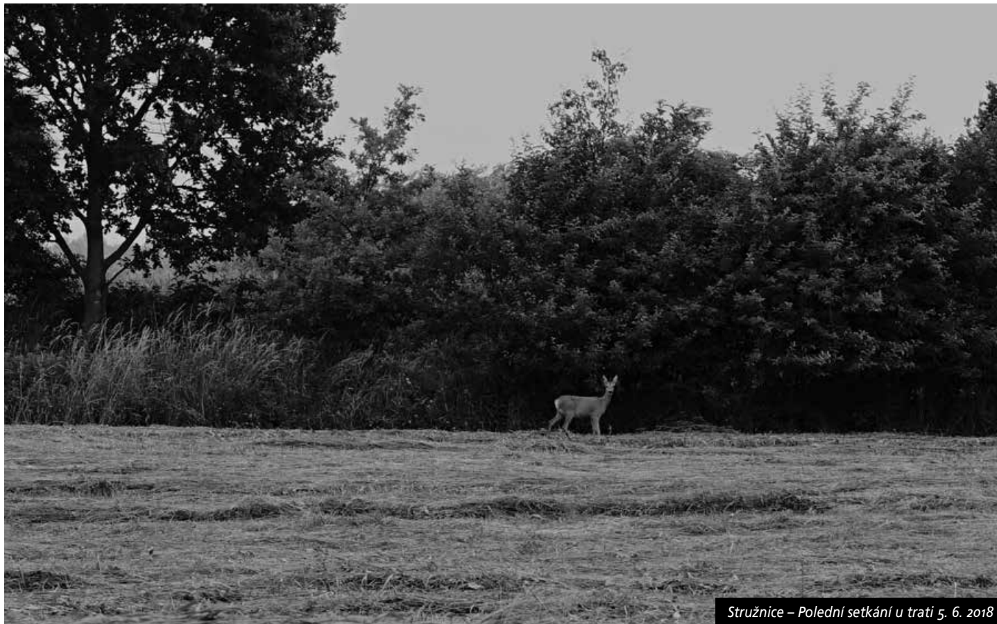
Stružnice – Polední setkání u trati 5. 6. 2018