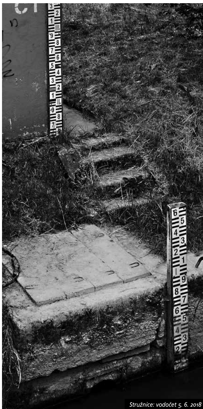
Stružnice: vodočet 5. 6. 2018

Poznámka OÚ Stružnice: Běžný stav na oficiálním vodočtu ČHMÚ ve Stružnici u starého mostu bývá během roku mezi 50 až 80 cm, na konci suchého léta 18 cm, výjimečně i 11 cm. V současnosti (5. 6. 2018) však tato stanice registruje 4 cm a průtok pouhých 2,39 m 3 /s. Na to, že limnigrafem ve Stružnici odtéká naprostá většina povrchové vody z Českolipska – kromě vlastní Ploučnice např. i voda z Máchova jezera, Bobřího potoka (vč. všech rybníků) až od Verneřic nebo z Lužických hor (Šporka, Svitávka, Panenský potok) - je tento průtok na začátek června kriticky nízký.