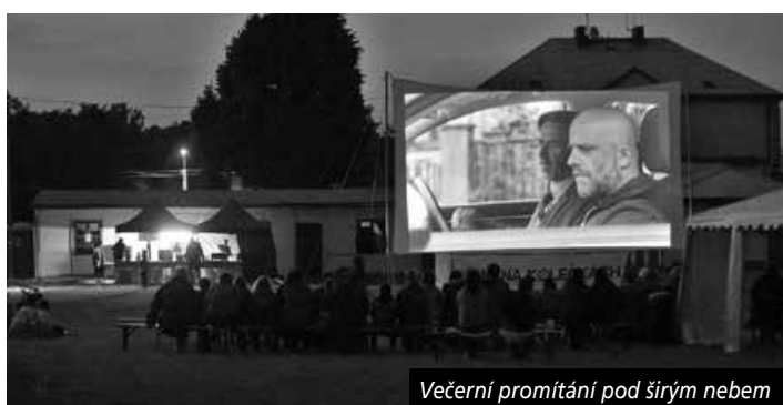
Večerní promítání pod širým nebem