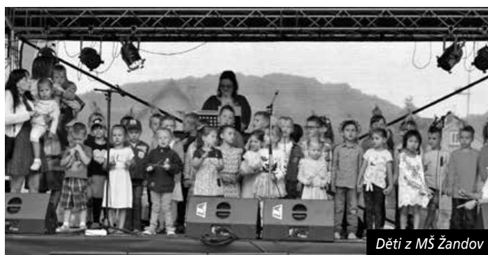
Děti z MŠ Žandov