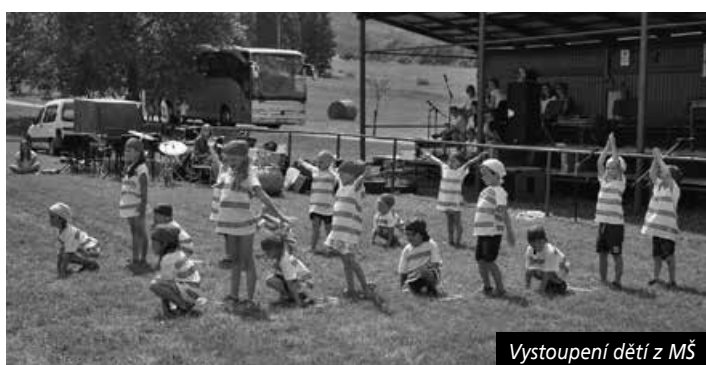
Vystoupení dětí z MŠ