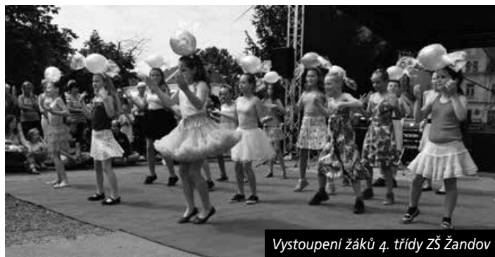
Vystoupení žáků 4. třídy ZŠ Žandov