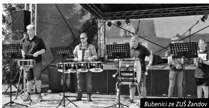
Bubeníci ze ZUŠ Žandov